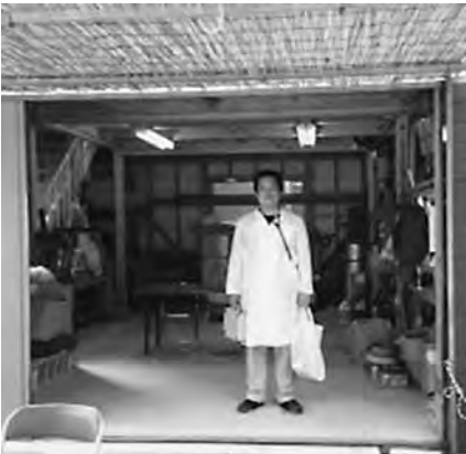
神津島診療所にて